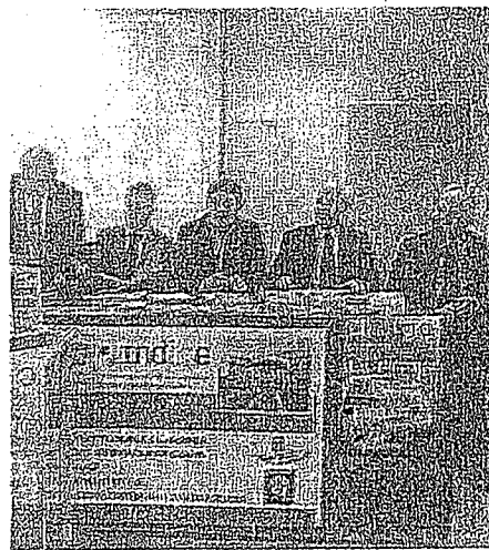
La cerimonia. Si è parlato di modo corretto di praticare lo sport