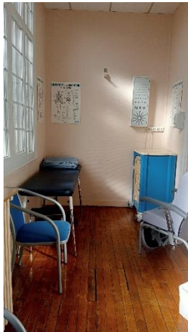
Infermeria della scuola