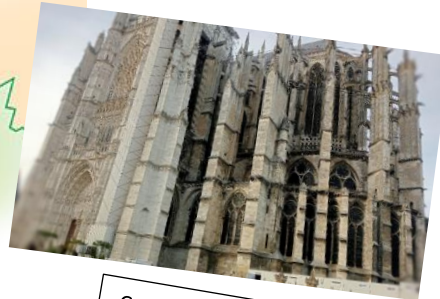
Cattedrale di Beauvais