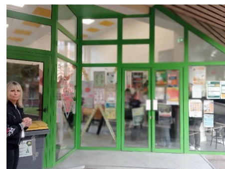
La vie scolaire