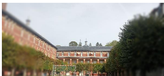
Visita virtuale del Liceo Félix Faure