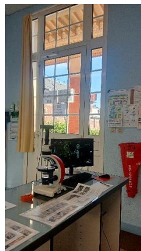
Laboratorio di petrografia e geologia