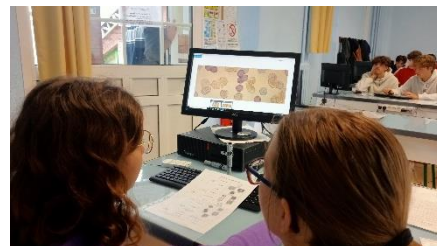
Osservazioni pollini _ ricostruzione paleoclimatica