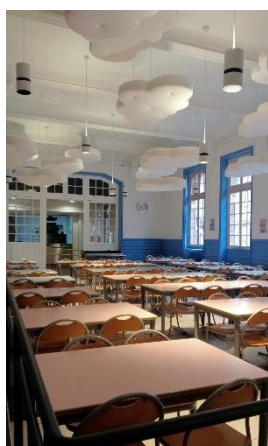
La mensa scolastica