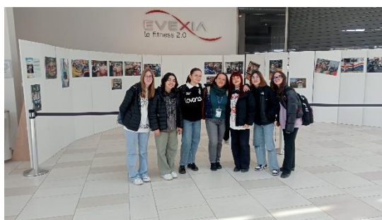
Le alunne del IIS Fermi _progetto Erasmus