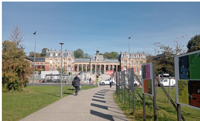
Lycée Félix Faure