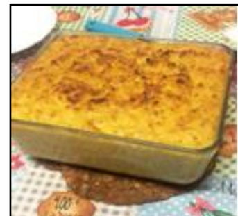
Bicalhau com natas

Je ne peux pas oublier aussi le tour de Sintra avec son Palais National et ses cheminées que nous avons visité le vendredi, son musée a gardé une partie du mobilier appartenue aux derniers rois.