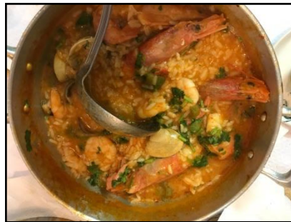
Arroz de marisco