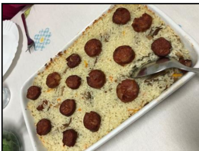
Arroz de pato

Je dois dire qu'elle n'est pas aussi bonne que la cuisine italienne mais toutefois ...pas mal!