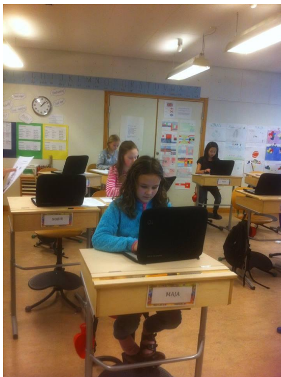
Un'aula della scuola elementare di Vasteras