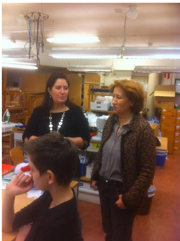
Scuola elementare a Vasteras