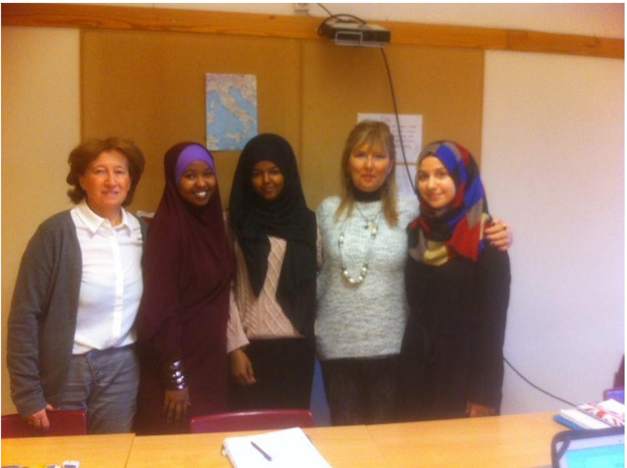
Con le tre alunne che studiano lingua tedesca di nazionalità irakena, afgana e pakistana